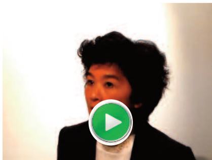
Témoignage Caisse des Dépôts